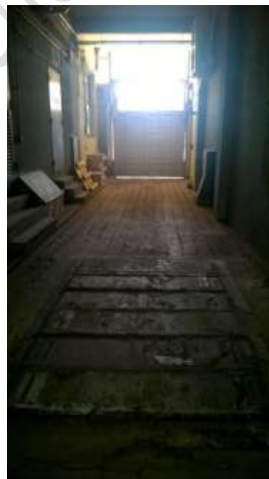
Vista salida de emergencia por acceso vehicular (falta señalar)