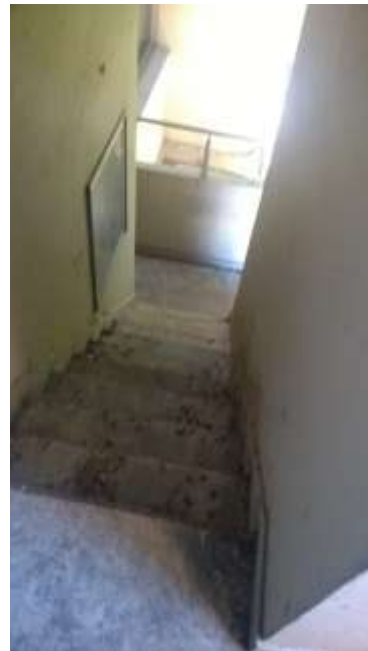
Escalera externa de evacuación – Piso 2 (Izq) – Piso 1 (Der)