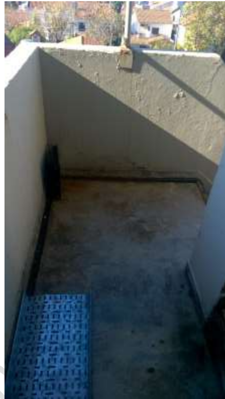
Escalera externa de evacuación – Piso 3