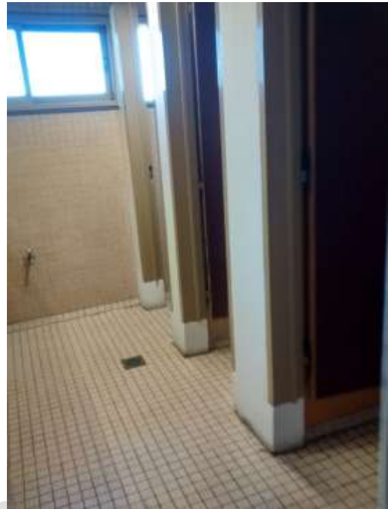
Piso 3 baño masculino (único en el piso)