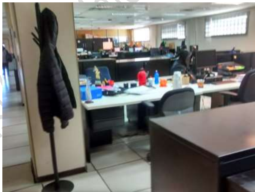
Piso 2 Puestos de trabajo