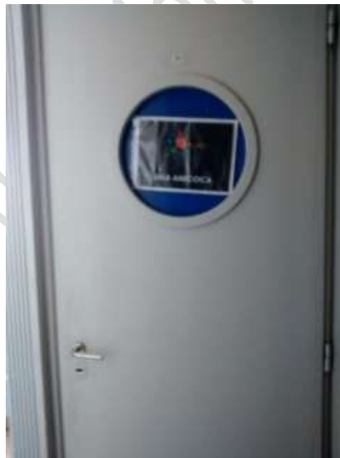
Piso 3 sala anecoica