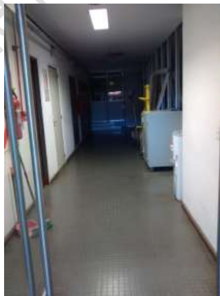
PB acceso a equipos repartidor y via de escape