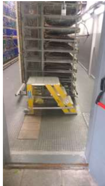
Escalera externa de evacuación – Planta Baja (Izq) – Repartidor General (Der)