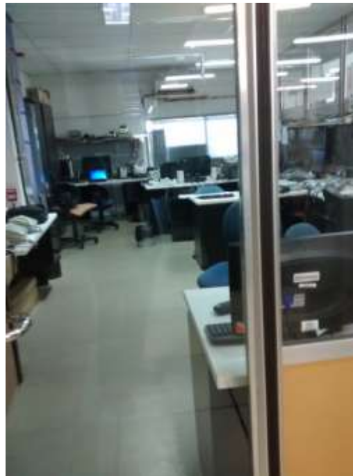
Piso 3 -Sala de prueba de terminales con escasa iluminación