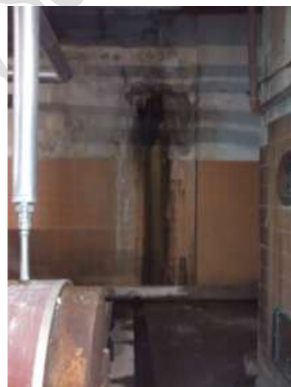
Segundo subsuelo con agua en el piso