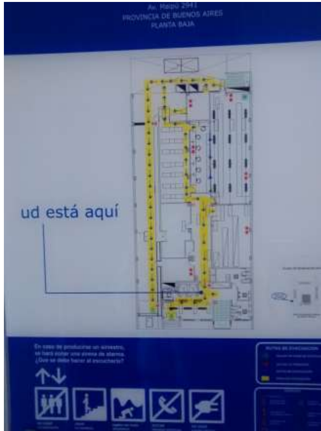
PB plano de evacuacion