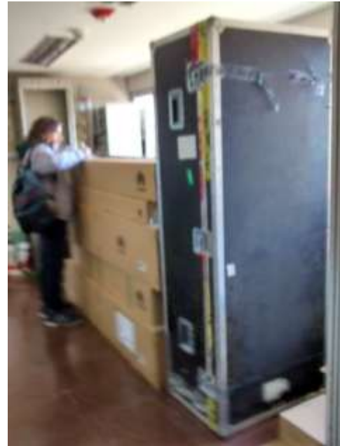
Piso 3 - Entrada ascensores con materiales apilados