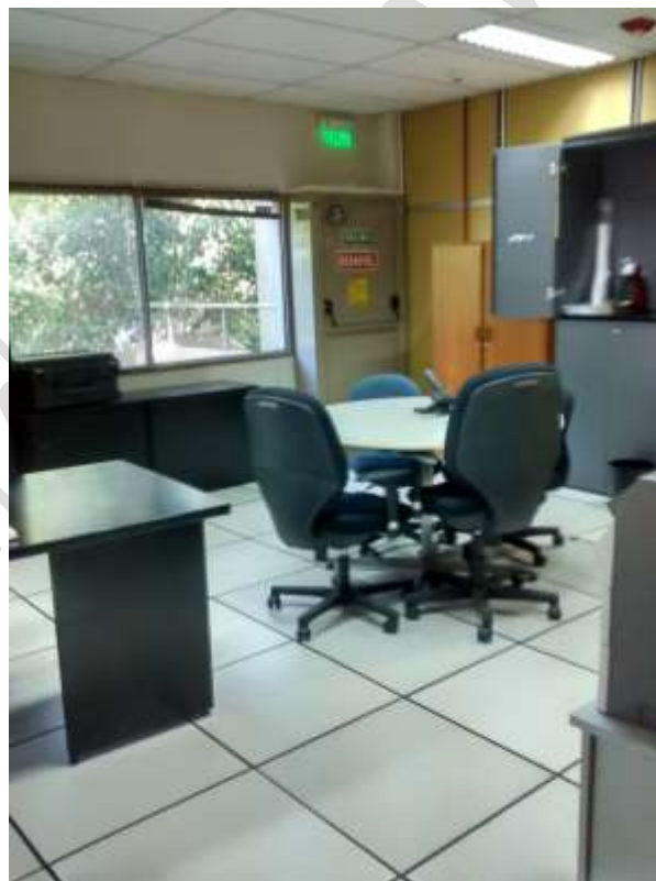
Piso 2 Puestos de trabajos salida de emergencia contrafente