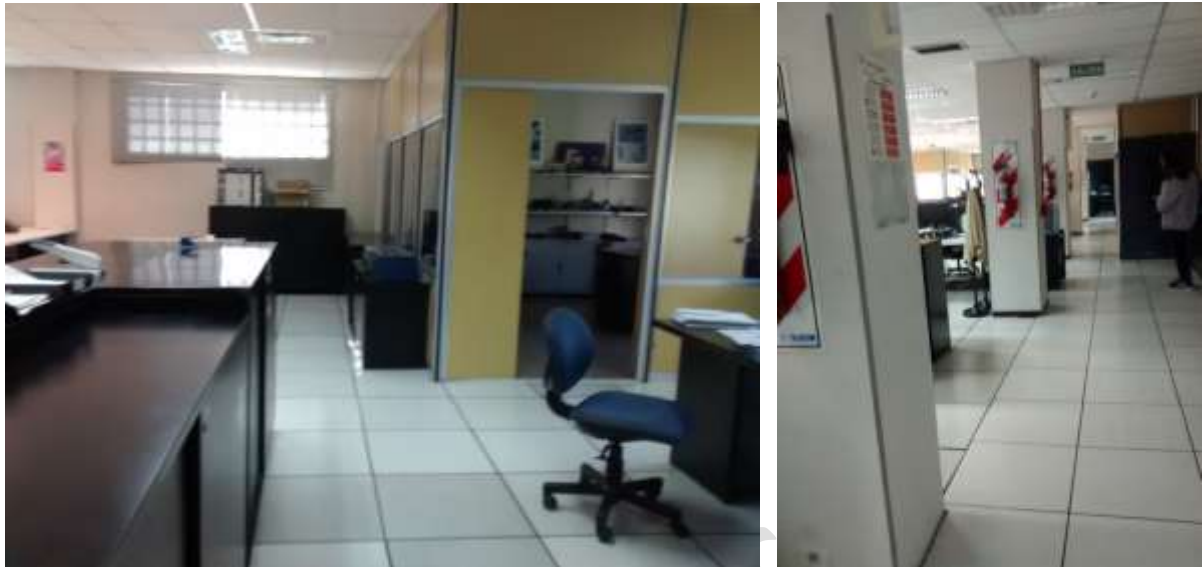
Piso 2 Puestos de trabajo y matafuegos