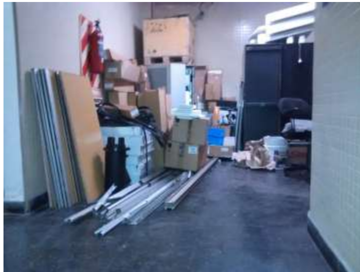
Primer subsuelo Acceso a ascensor con materiales depositados en el mismo