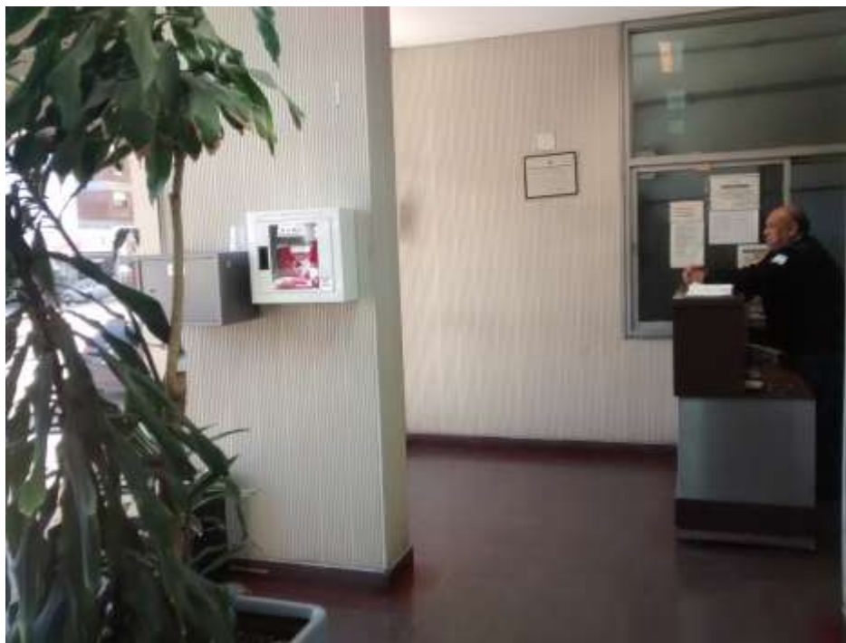
Planta Baja - Entrada del Edificio - Puesto de guardia (vista del desfibrilador)