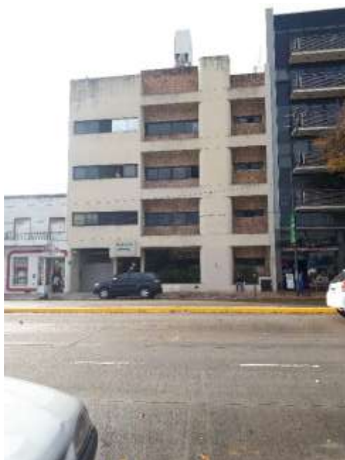
Vista edificio Olivos