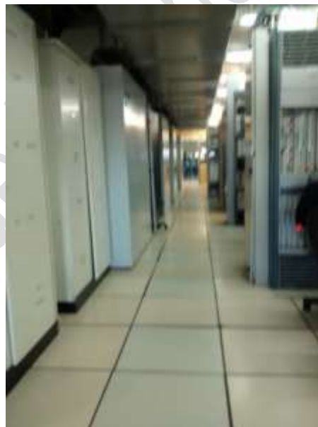
Piso 3 - Vista de equipos y acceso a sala de prueba de terminales