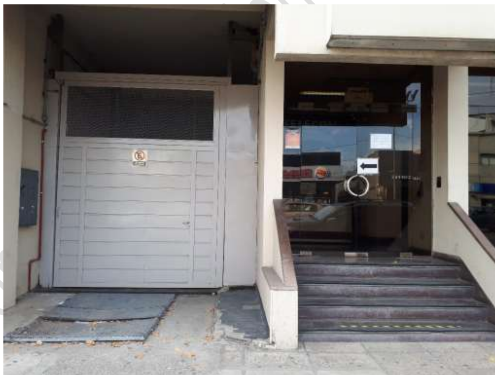
(Izq) entrada vehicular – (Der) entrada del personal