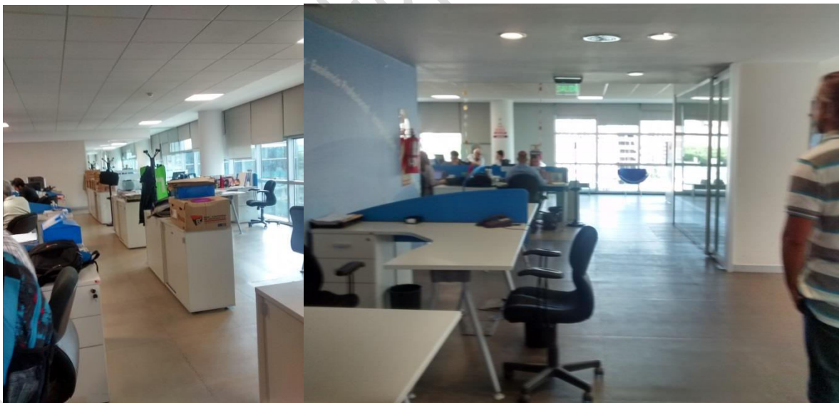
Vistas de las posiciones de trabajo piso 6