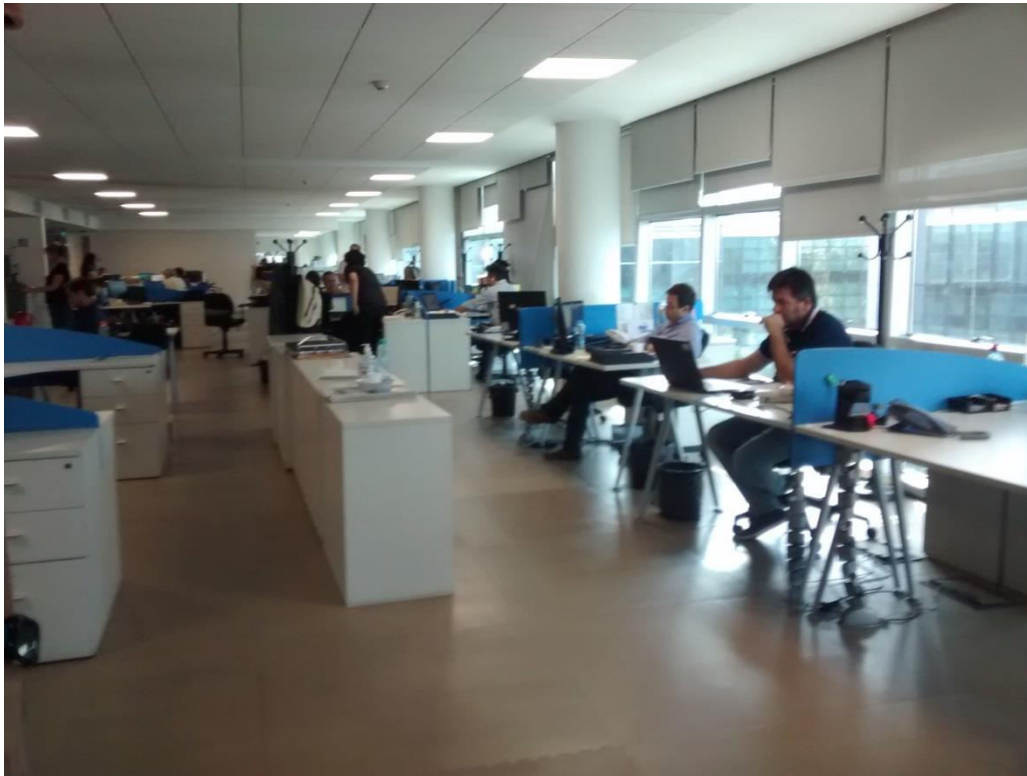
Vistas de las posiciones de trabajo piso 5