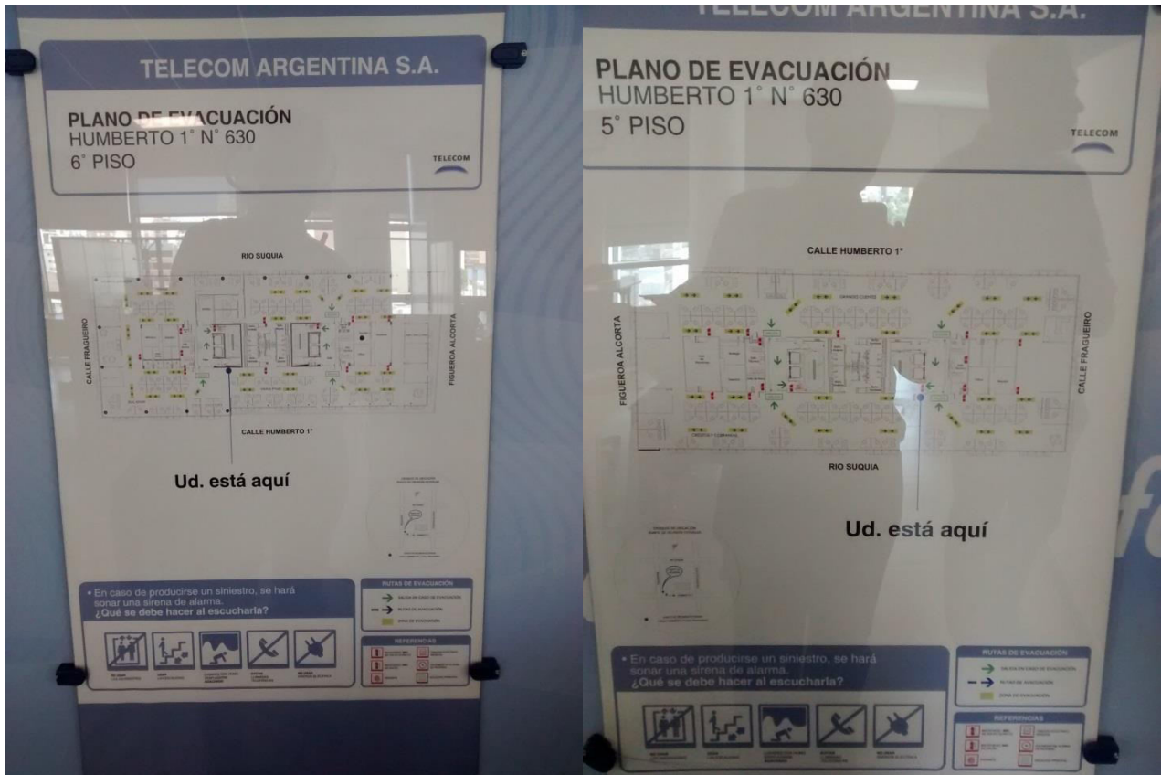
Plano de Evacuación del Edificio Pisos 5 y 6