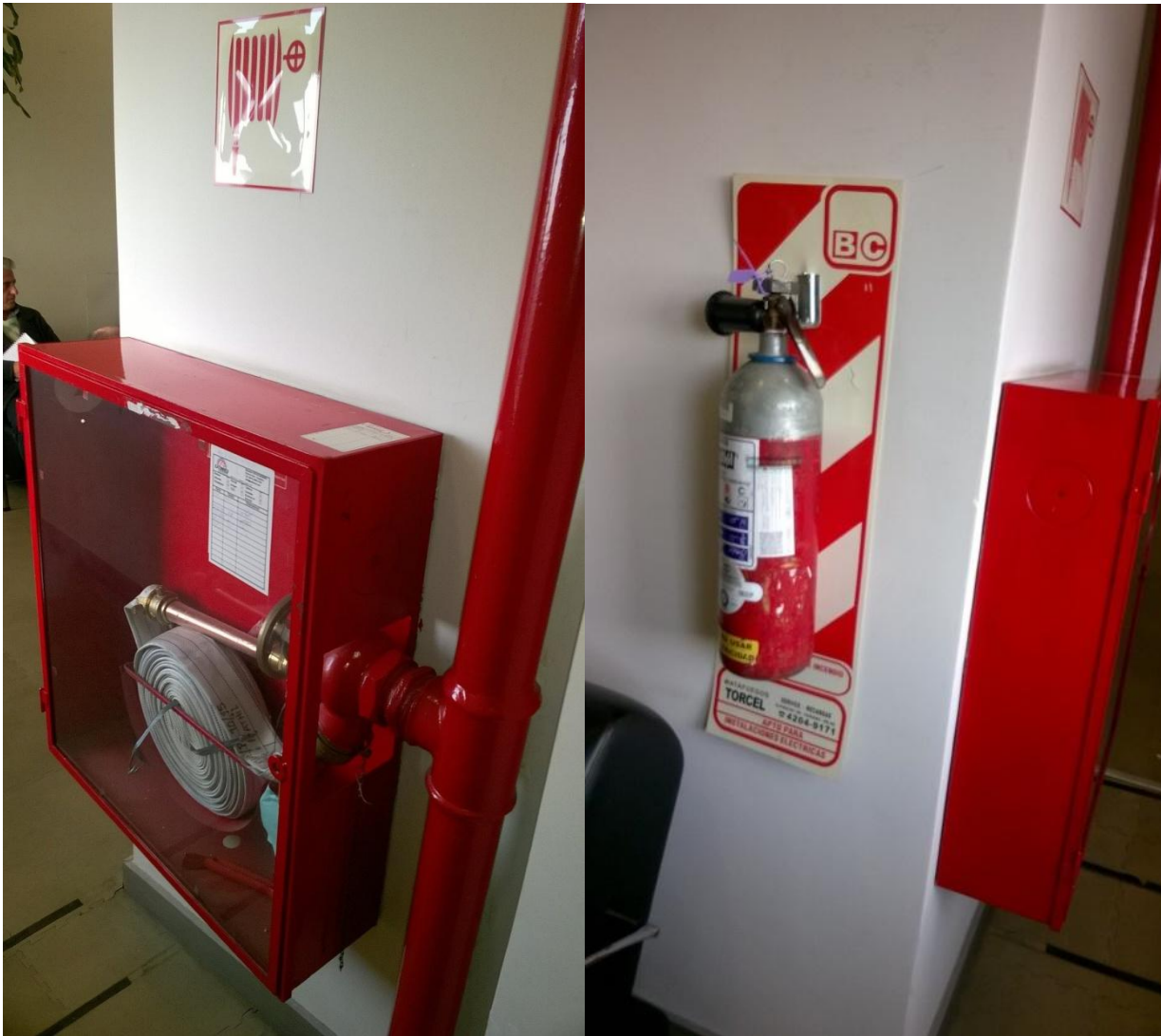
Nicho hidrante y extintor