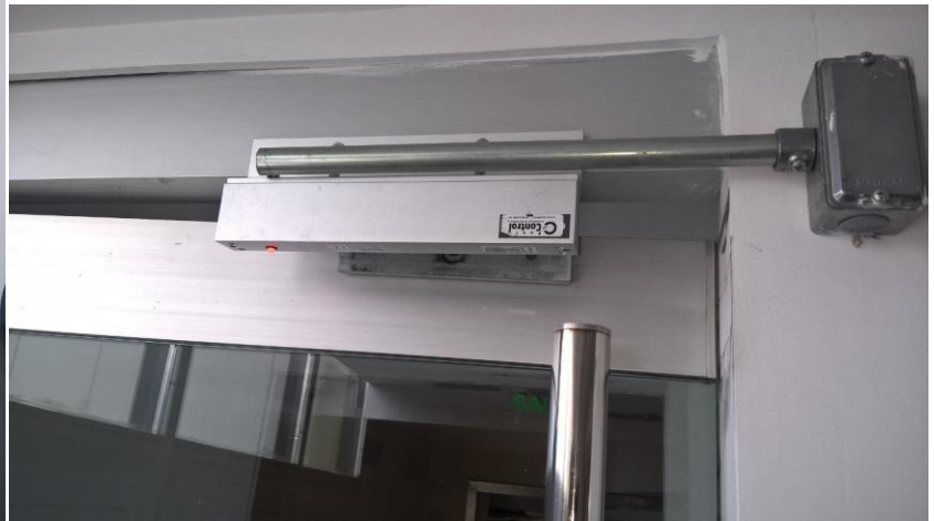
Puerta piso 17