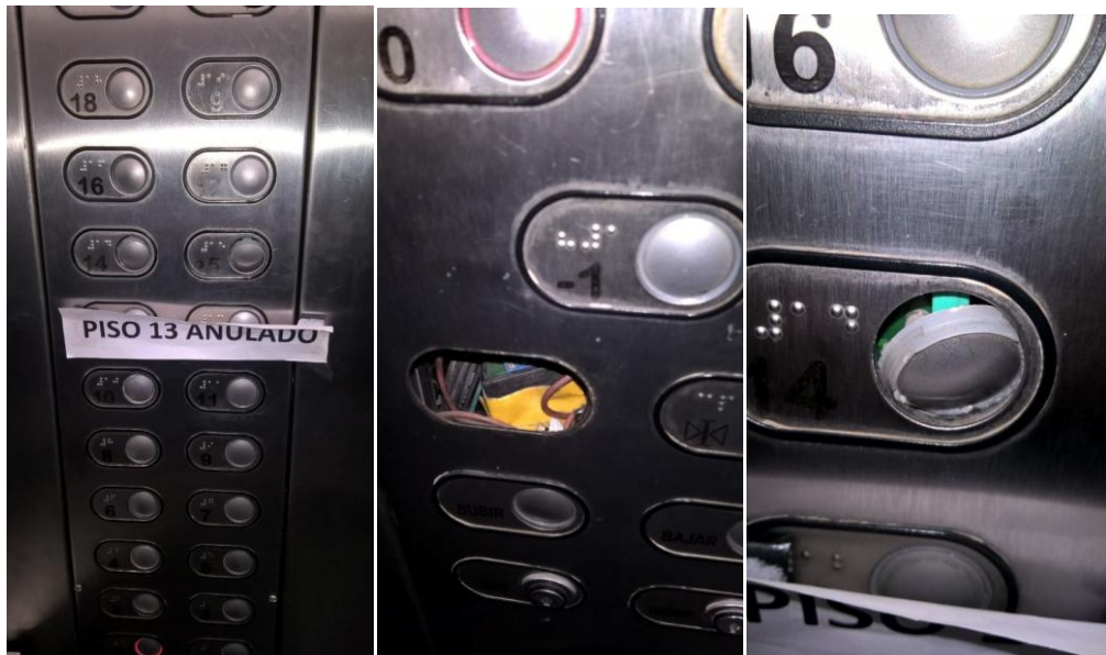
Botonera con botones trabados y faltantes